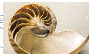
Vertiefung & Besonderes