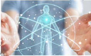
Basis Medizinisches Wissen