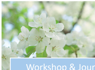
Workshop & Jour Fix